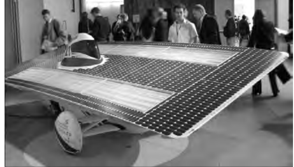
De zonneauto van het Solar Team Twente

Indien dat wel gebeurt dan wordt de uitvinding namelijk geacht niet nieuw meer te zijn. De openbaarmaking kan door velerlei manieren gebeuren, bijvoorbeeld door het op een beurs presenteren, op de website zetten of in een vakblad te publiceren.