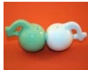
Peper en zout stelletjes.

"De kosten om elk model te deponeren zijn echter, gezien de totale kosten, niet te verantwoorden" besluit hij.