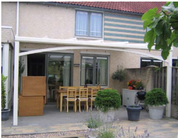
Alibow terrasoverkapping (6 elements)

"Zo ook de ontwikkeling van de Alibow, een geheel nieuwe terrasoverkapping op basis van een gebogen toogdrager. Deze innovatieve toogdrager geeft de terrasoverkapping een kenmerkend uiterlijk", vervolgt hij.