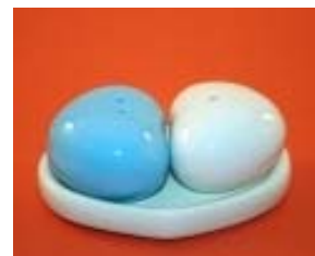
Nogmaals enkele peper & zoutstelletjes.