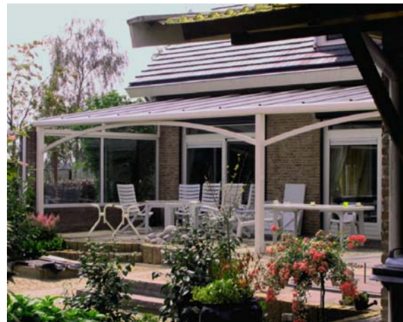
Alibow terrasoverkapping (2x7 elements)

Met het merk- en het modelrecht kan nu eventuele namaak effectief bestreden worden waarbij eventueel ook nog het auteursrecht ingeroepen kan worden.